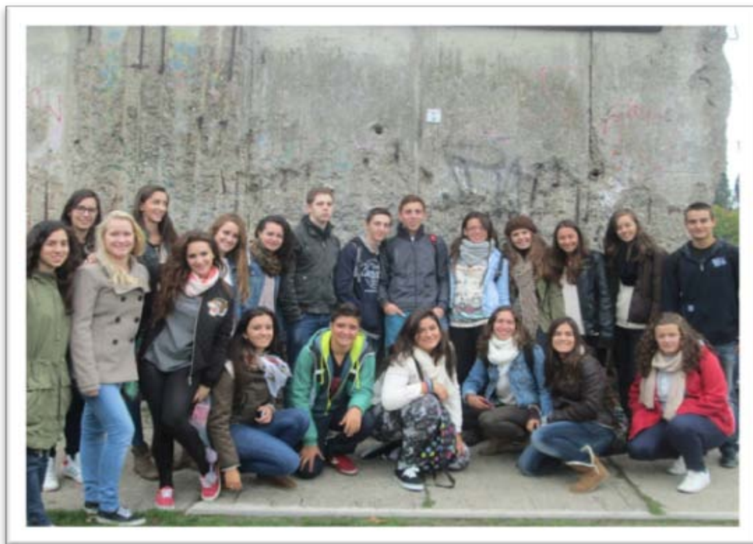
Grup espanyol al mur de Berlín, amb alguns amfitrions alemany.

L'intercanvi amb Alemanya es va produir el passat mes de setembre, només començar les classes. El dimarts dia 15 quasi una vintena d'alumnes de batxillerat ens vam enlairar des de Manises rumb a Berlín. Érem els «encarregats» i els privilegiats de gaudir de l'aprenentatge de les cultures alemanyes.