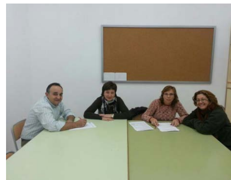
Alguns membres de la Junta de l'Ampa, reunits.

L'AMPA és una associació de mares i pares d'alumnes, sense ànim de lucre que es dedica a finançar les activitats dels alumnes. Pots formar part de l'AMPA si ho comuniques a algun membre de l'AMPA, tots els anys es renova la junta directiva i tot el que vulga formar part pot estar en ella.