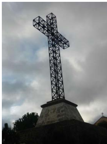
Creu del Preventori

Vam començar a pujar i a disfrutar del paisatge. En arribar dalt dinàrem tots junts i vam estar allí al voltant d'una hora o hora i mitja, fent-nos més fotos.