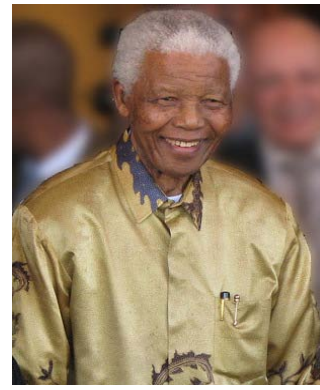
Nelson Mandela als seus últims anys.

El 9 de Maig va ser nomenat president de Sud-àfrica. Va iniciar l'estratègia GEAR en Juny de 1996, per aplicar una política monetària antiinflacionista, disciplina fiscal i assignació de presupostos prudents en Sud-àfrica. Implantà la llei d'equitat d'ocupació basada en la "discriminació positiva", per a beneficiar els "No blancs".