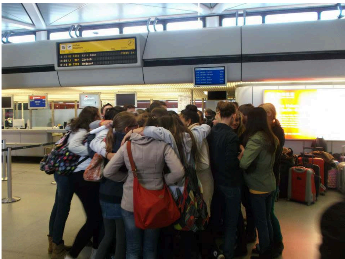
Càlid comiat a l'aeroport de Berlín: Vos esperem a Picassent, amics!

Us recomane que si teniu l'oportunitat d'anar a aquest intercanvi en les successives edicions no dubteu de participar-hi. Gaudireu d'una bona experiència, de conèixer gent, i veure formes de viure i noves cultures.