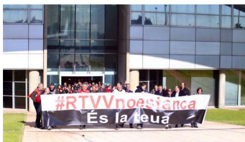
Els treballadors manifestant-se a les portes de RTVV

Després de la negativa dels treballadors de RTVV a que es realitzara l'ERO, el president Albert Fabra va decidir finalment tancar aquest canal de forma definitiva.