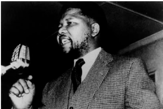
Nelson Mandela, els primers anys d'activisme

Respecte als seus estudis va cursar els estudis universitaris de dret a Johannesburg. Tan sols un any després va aparèixer a Sudàfrica l'Apartheid, que va ser una política de segregació racial i d'organització territorial. L'objectiu era separar les persones de color de les altres en el terreny jurídic amb una jerarquia en la qual els blancs tenien més domini, i la creació de territoris reservats per a blancs o negres.