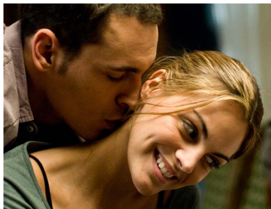
Fotograma de "No estás sola, Sara"