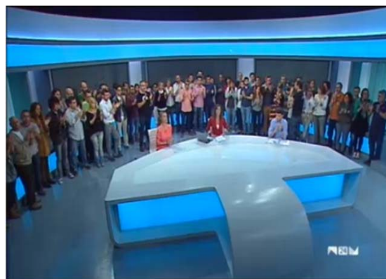
Últimes hores d'emissió

El tancament de RTVV, ha suposat, tant per als joves com per als més majors, una gran pena ja que molta gent ha crescut veient aquest canal i gaudint de la seua programació en valencià, al ser l'únic canal autonòmic. Per als més jòvens, que passaren moltes hores veient ja fora "Babalà Club", com també per als més majors "L'alqueria Blanca", ha suposat molta pena, a causa que els primers de menuts gaudien de dibuixos en valencià. Per als segons haver estat esperant la continuació d'aquesta sèrie tant de temps.