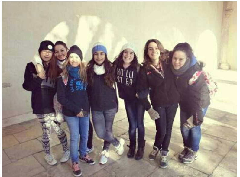
Un grup d'amigues de 2n, participants en l'excursió

En finalitzar aquella trobada ens firmà uns quants llibres, anàrem cap a l'autobús perquè ens portara al peu de la muntanya del "Preventori", el