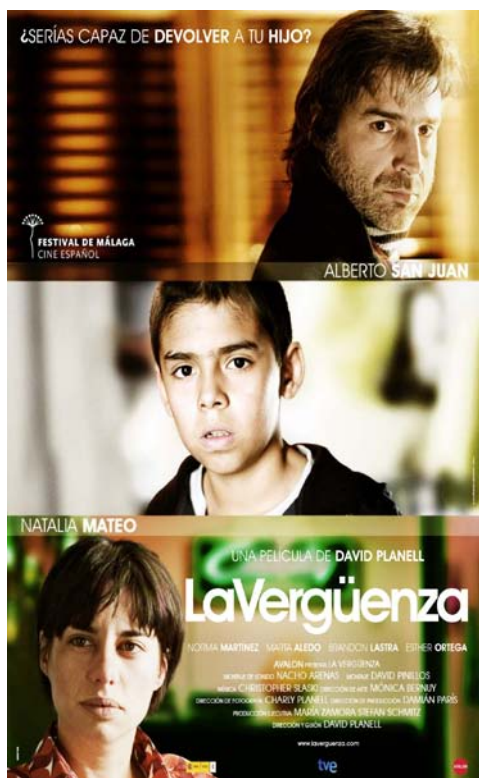
Cartell de la pel·lícula La vergüenza