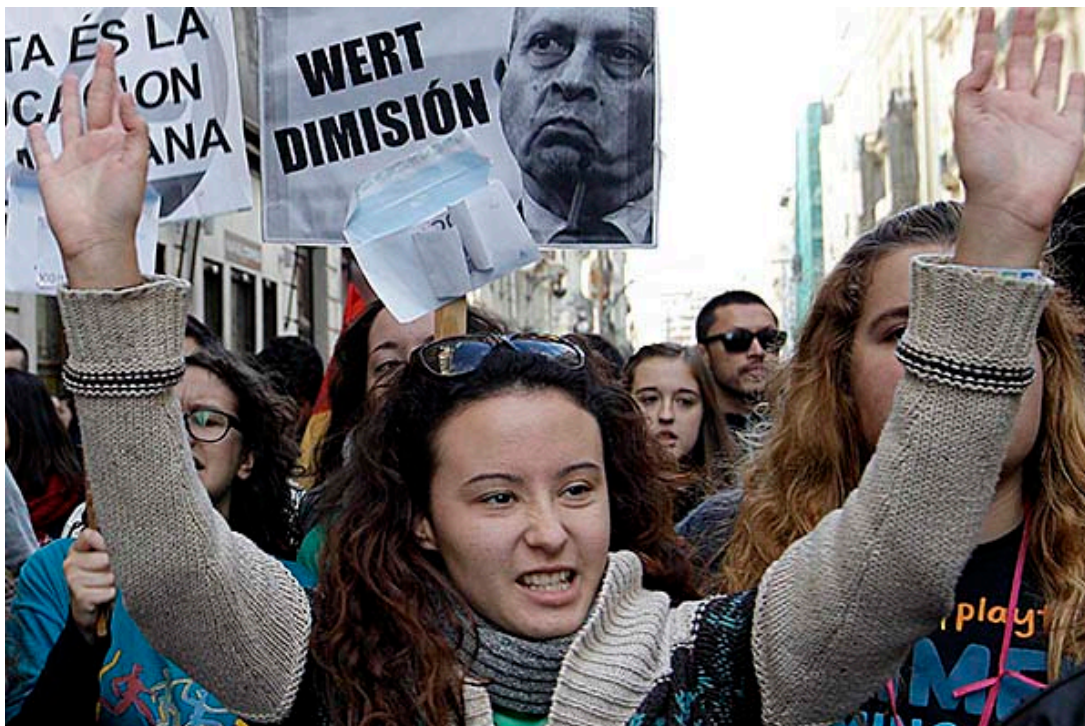
Imatge de les protestes a València contra la llei Wert, que motivà les darreres vagues d'estudiants.

Les vagues les convoquen, perquè puguen veure que no estem conformes amb les lleis que posen, i per a protestar, o dir que no volem seguir sota aquestes condicions. Per exemple les vagues que hem convocat els estudiants últimament eren per a protestar contra la LOMQE, una llei educativa que tots els que hem acudit a la vaga ha estat (en principi) perquè no estàvem d'acord amb eixa llei.