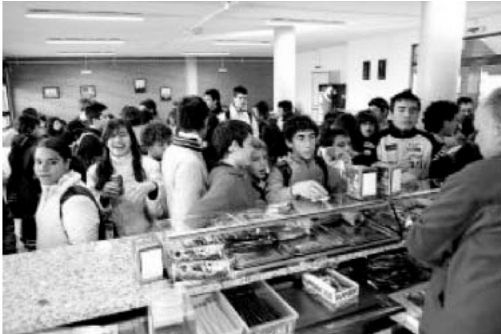
Una imatge a la qual ja no estem acostumats: una cafeteria plena de bocates i vida

Si no es completa el procés d'adjudicació prompte, la cafeteria continuarà servint per a altres usos de l'institut.